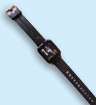
《スマートウォッチ》