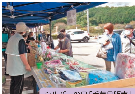
シルバーの日「手芸品販売」