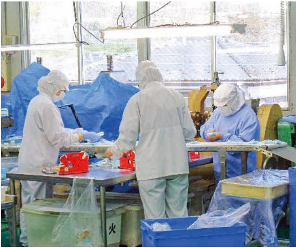
派遣会員さんの作業風景