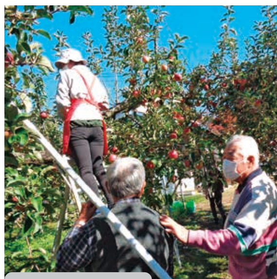
親睦会のりんご狩り